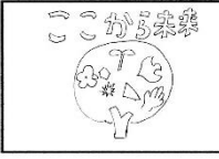
↓演奏動画はこちらから↓